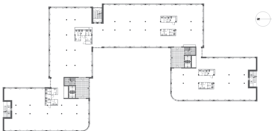
Plan d'étage type

La structure est composée de matériaux classiques, avec des dalles et murs en béton armé, des escaliers et piliers en préfabriqué, les façades métalliques sont isolées selon le label Minergie®. Le verre a été choisi pour ses valeurs thermiques et acoustiques haute performance.