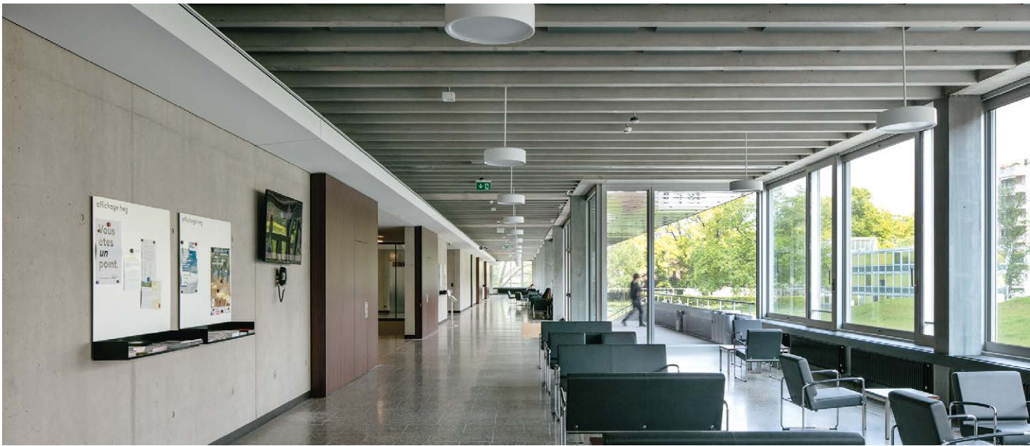
Plans des niveaux